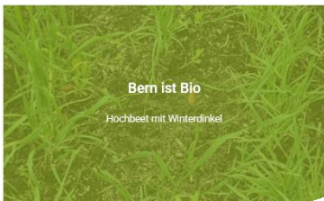
Bern ist Bio Hochbeet mit Winterdinkel