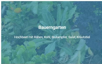
Bauerngarten Hochbeet mit Rabe, Kohl, Blütpflanze, Salat, Krautstiel