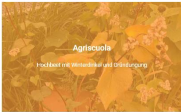
Agriscola Hochbeet mit Winterdinkel und Gründüngung

Auf der Rückseite der Flipbox finden Sie zu jedem Beet ein Dossier, unter anderem mit Hinweisen zu passenden Unterrichtsmaterialien, Verknüpfung mit dem Lehrplan 21 und weiteren Informationen und Angeboten.